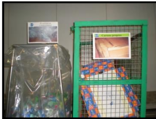
Collecte des déchets

→ Action N° 20 : Planète Végétal amplifie le tri sélectif des déchets (non organiques) qui sont générés en production et dans les stations de conditionnement.