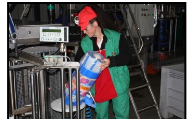
Bobine adaptée au personnel féminin

→ Action N° 23 : Planète Végétal poursuit, en tant qu'entreprise pilote, en collaboration avec les opérateurs sur lignes et l'aide de la MSA (Sécurité sociale agricole) des actions d'amélioration aux postes de travail visant à réduire le port des bobines d'emballage dans les stations de conditionnement.