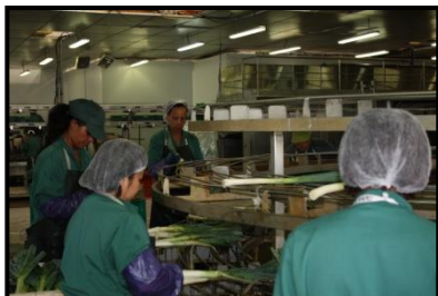
Poste de travail en carrousel

➔ Action N° 16 : Intégration des principes d'ergonomie et du confort des postes de travail.