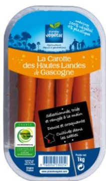
barquette 100% végétale

La production d'une barquette PLA nécessite 2 fois moins d'énergie et rejette 2 fois moins de gaz à effet de serre que la production d'un polymère synthétique (plastique).