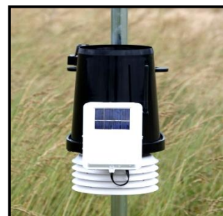
Station météo fonctionnant à l'énergie solaire

Résultats : Toutes les stations météo et sondes d'humidité sont alimentées électriquement par des accumulateurs rechargés uniquement grâce à des panneaux solaires