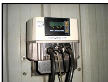
Capteur-régulateur de pression

→ Action N°21 : Installation de capteurs de pression électroniques sur nos forages permettant d'ajuster les quantités d'eau nécessaires pour laver nos carottes avant de les emballer.