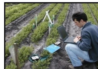
Prélèvements et analyses

Déclenchement raisonné des différents traitements phytosanitaires.