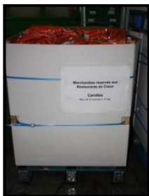
Dons de carottes (box de 200 kg)

Résultats : 2200 tonnes de légumes données aux Restos du Cœur et à la Banque Alimentaire depuis 2006, équivalent à plus de 12 millions de portions repas.