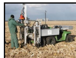
Station mobile d'analyses

Résultats : connaissance exhaustive de la composition des sols des différentes parcelles et de leur évolution. Adaptation des apports, calculés et limités selon la richesse de ces sols.