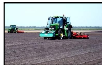
Tracteurs auto-guidés par GPS

→ Action N°9 : Substitution de consommation d'électricité classique au profit d'énergies renouvelables